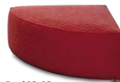
Pouf 95x95 Circle